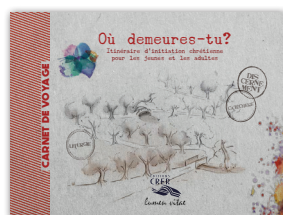
Où demeures-tu ? Carnet de voyage

ISBN : 978-2-85733-424-8 Format : 16,5 x 24 cm Prix : 19.90 € Broché - 196 pages Réf. CRER : 132289