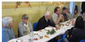
TABLE OUVERTE DU SAMEDI