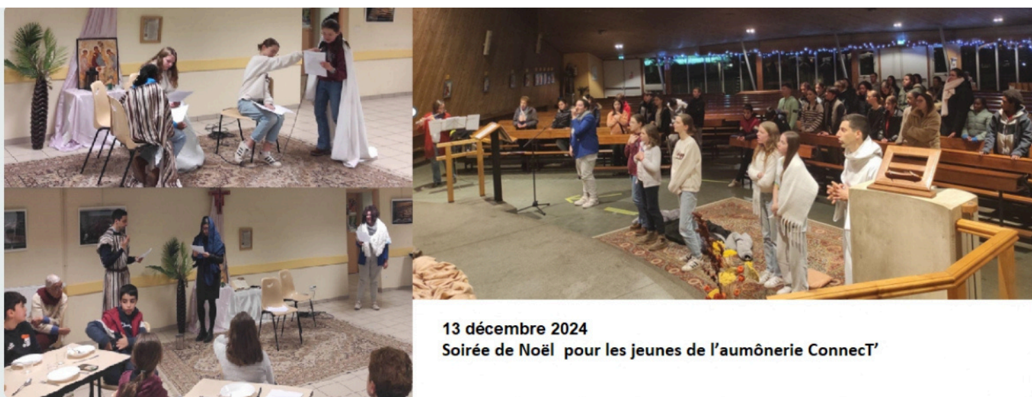
13 décembre 2024 Soirée de Noël pour les jeunes de l'aumônerie ConneCT'

Vendredi 13 décembre , les jeunes de l'aumônerie ConneCT, accompagnés de leurs convives (parents et paroissiens) ont partagé un très bon moment pour leur soirée de Noël. Un questionnaire ludique et interactif a permis de retracer les éléments appris pendant la période. Les invités nous ont rejoints à la belle louange dans l'église. Pour finir la soirée, des scénettes préalablement préparées ont été jouées au moment du repas, avec les talents de certains mis en lumière. Une coquiflette (tartiflette à base de coquillettes) délicieusement préparée par l'équipe goûter est venue régaler les papilles, avec une papillote pour terminer. Tout ConneCT' profite de cet article pour vous remercier de votre générosité lors de la vente des sablés le 8 décembre.