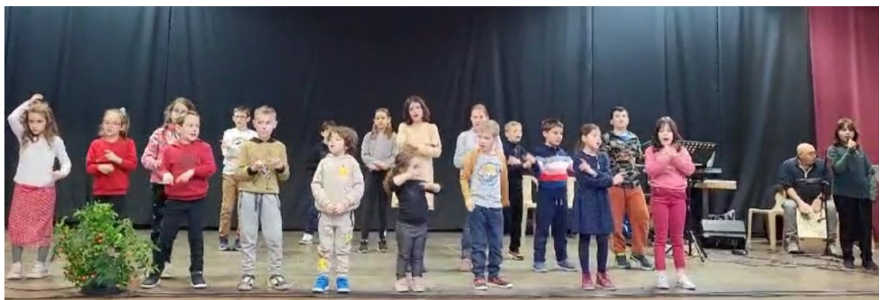
« Il n'y a personne comme Jésus », chantent les enfants du caté