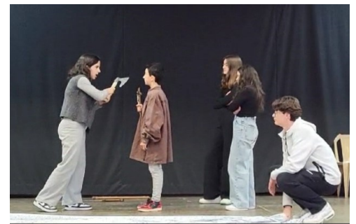
Saint François et le loup de Gubbio