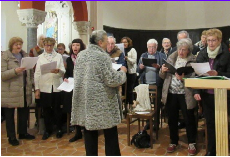
La chorale « La clé des chants » animait la célébration

Le 17 novembre, lors de la messe de Pont de Chéruy, il a été donné aux futurs mariés de Sainte-Blandine de franchir une nouvelle étape. En effet, au cours de cette célébration, il leur a été remis une bible dans laquelle ils ont trouvé, écrit sur un carton, le nom d'un couple parrain. A l'issue de la messe, au cours d'un apéri-