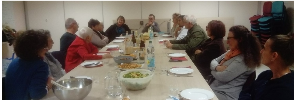
Chaque rencontre Alpha commence par un repas fraternel

Nous avons ensuite recherché dans l'Evangile de Saint Luc et dans les actes des apôtres si l'argent est seulement un