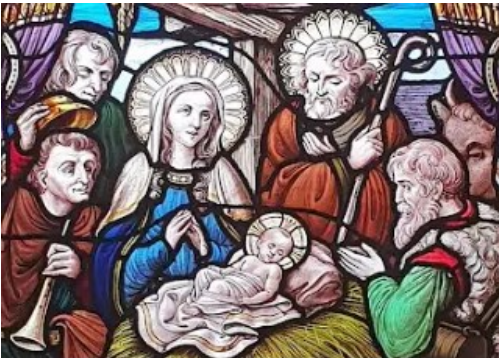
vitrail de l'église Saint-Jean Berchmans, Bruxelles

Au cours de l'histoire, les artistes ont représenté la crèche sous les formes les plus variées. Au Moyen Âge, la crèche est représentée le plus souvent comme un réceptacle de bois où la paille fait à l'enfant un lit moelleux ; elle est située alors au cœur de la vie paysanne de tous les jours.