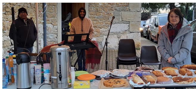
Pâtisseries et musiciens ont accueilli les parents et leurs enfants pour le temps du goûter

Vous pouvez scanner ce QR code pour découvrir la crèche vivante en vidéo