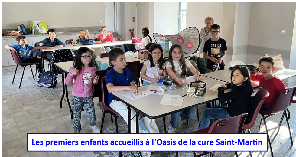
Les premiers enfants accueillis à l'Oasis de la cure Saint-Martin

Lundi 9 septembre, grande première à la cure Saint-Martin de Vilette-d'Anthon : l'Oasis a démarré avec neuf enfants de Vilette, Janneyrias et Anthon, rejoints par six autres écoliers le lundi suivant.