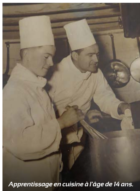
Apprentissage en cuisine à l'âge de 14 ans.