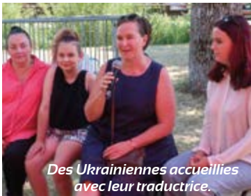
Des Ukrainiennes accueillies avec leur traductrice.