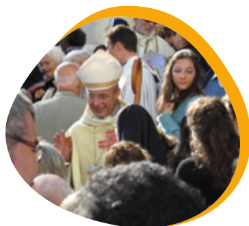
Bain de foule de notre nouvel évêque.