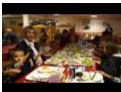
benedicite en famille