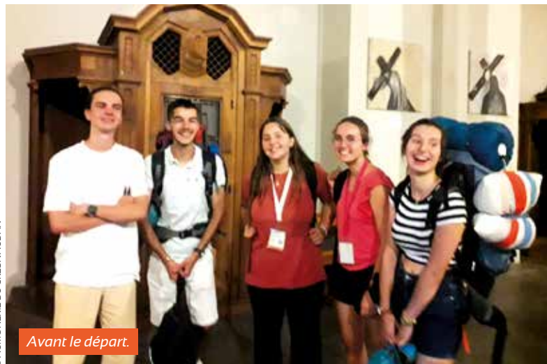
Avant le départ.

Nous sommes rentrés fatigués mais forts de l'espérance et de la joie de ces journées vécues ensemble !