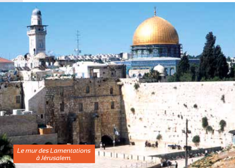
Le mur des Lamentations à Jérusalem.