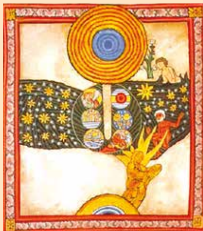
Les six jours de la Création, une vision d'Hildegarde.

Les chemins de Dieu, Sainte Hildegarde de Bingen