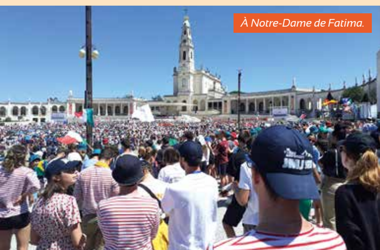
À Notre-Dame de Fatima.