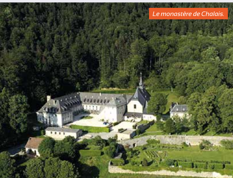
Le monastère de Chalais.

» En 2015 est parue l'encyclique du pape François, Laudato si' . Le contenu de cette encyclique qui s'annonçait très écologique nous a surprises et stimulées. Surprises d'abord car nous nous sommes aperçues qu'il s'agissait non d'un texte purement écologique