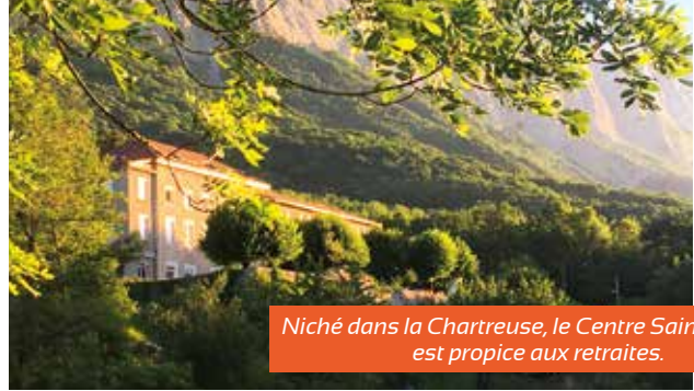
Niché dans la Chartreuse, le Centre Saint-Hugues est propice aux retraites.

Le Centre spirituel Saint-Hugues à Biviers propose de longue date des retraites avec cette intuition que la marche en montagne et la contemplation de la Création participent au chemin spirituel des personnes venues se ressourcer. Cette proximité à la nature se conjugue avec la place donnée au corps et à l'ouverture de nos cinq sens à la Création par des propositions spirituelles avec des composantes très incarnées. En 2015, l'appel du pape à une écologie intégrale dans son encyclique Laudato si' est venu rejoindre les intuitions profondes portées par saint Hugues et la spiritualité ignatienne. Mais c'est l'intérêt grandissant pour l'écospiritualité qui va pousser le Centre à proposer dès 2017 une retraite visant à expérimenter une approche écospirituelle nourrie des merveilles offertes par la contemplation de la nature en montagne. Cette session intitulée « contempler la Création en montagne » se déroule sur une semaine en début d'été.