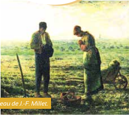
Le tableau de J.-F. Millet.