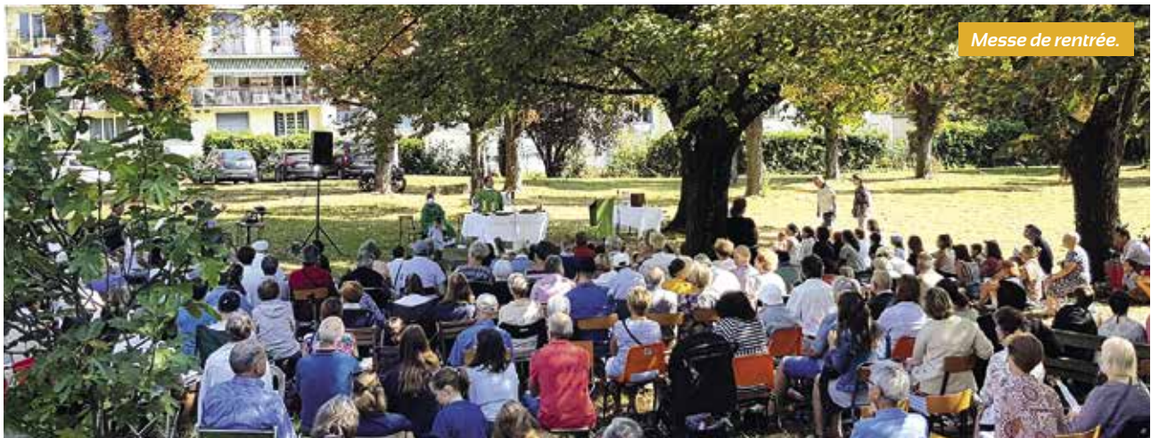
Messe de rentrée.

Inscription ou renseignements auprès de Catherine Gauvain : catherine.gauvain@live.fr