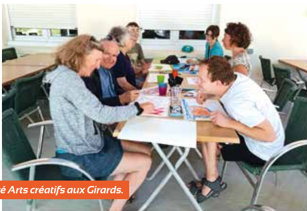
Activité Arts créatifs aux Girards.