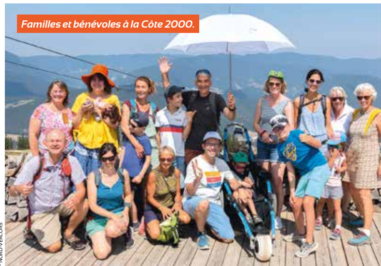
Familles et bénévoles à la Côte 2000.

L'association se charge de l'organisation des séjours, de week-ends, de journées avec une ou plusieurs familles. L'association fait du « sur-mesure », elle s'adapte à chaque personne fragilisée, aux contraintes liées à la maladie ou au handicap. L'organisation est flexible : des journées avec une ou plusieurs familles, un week-end, un séjour plus long. Nous disposons de plusieurs supports qui nous permettent de vous faire bénéficier du magnifique territoire de montagne,