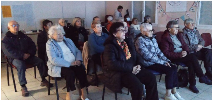
Le 5 décembre, pendant la projection du film