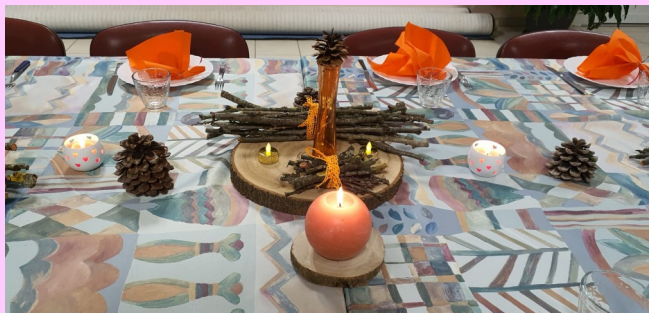
La table est prête pour le repas et le partage

Pour tout renseignement sur le parcours Alpha, vous pouvez contacter Jean-Yves ou Anne-Marie Gros au 07 86 13 20 90