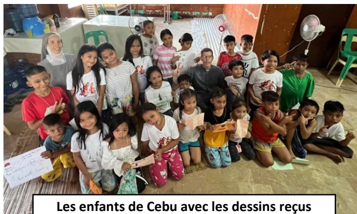
Les enfants de Cebu avec les dessins reçus

A Cebu, j'ai pu partager avec les enfants dont s'occupe ma sœur les dessins des enfants de notre paroisse, et j'ai rapporté les leurs. Ensemble nous avons prié les uns pour les autres. Bel échange fraternel et spirituel au-delà des frontières !