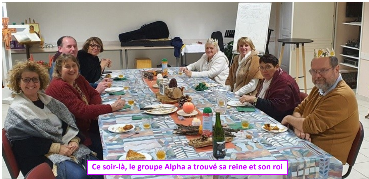
Ce soir-là, le groupe Alpha a trouvé sa reine et son roi