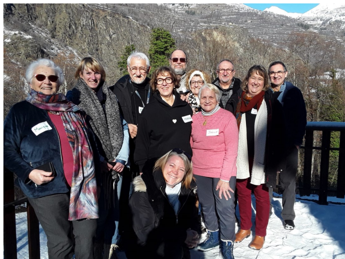
Le 14 janvier, le groupe Alpha au Bourg-d'Oisans

jours été à mes côtés et qu'il m'a donné la force de me relever à chaque fois que c'était nécessaire, tel un protecteur.