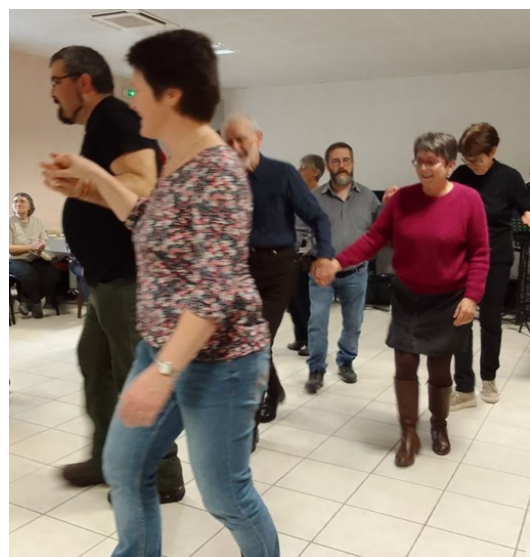
... entraînant chacun dans la ronde.

Après la nourriture spirituelle vient le temps des agapes : moment important d'échanges, joie de se revoir, de faire