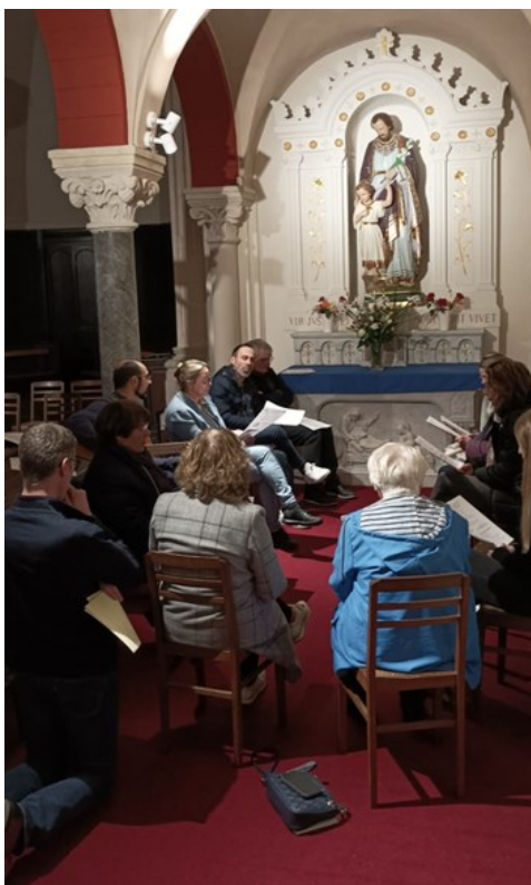
A 22 h, une heure animée par Pablo : « Avec les hommes, prier saint Joseph »

De 1 heure à 5 heures, on vit ensuite trois hommes en adoration au cœur de la nuit. Pour deux d'entre eux, c'était là une première expérience,